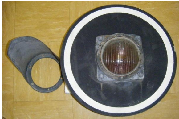
Feu rouge de passage à niveau avec lampe à incandescence

Feux tricolores (installés dans ma cuisine)