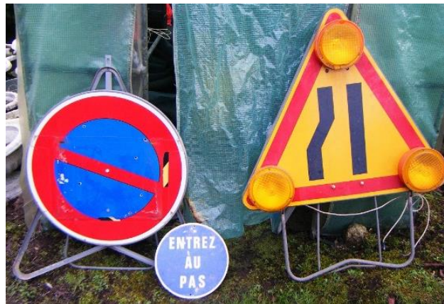
Lot de panneaux acquis à Angoulême

En parallèle, je possède des panneaux anciens et récents en plus des copies réduites au format papier.