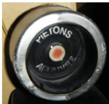
Bouton d'appel piétons marque « Silec » gamme Astron