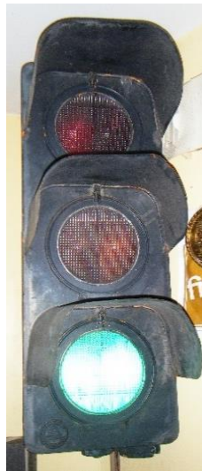
Marque « Gabarini M64 »

Feux tricolores (installés dans ma cuisine)