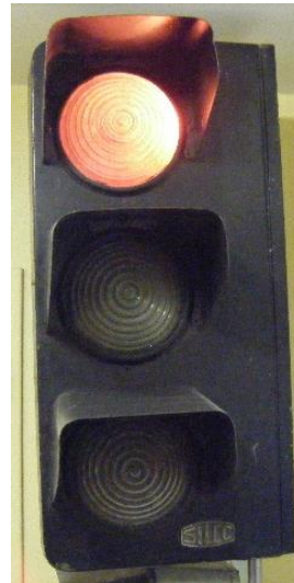
Marque « Silec » modèle standard