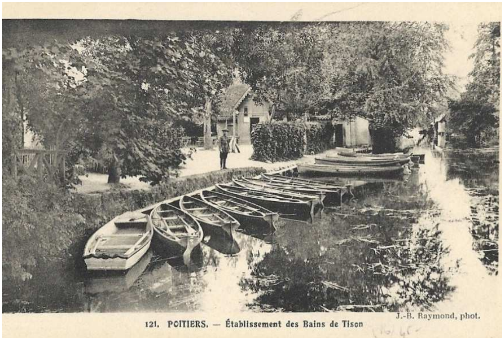
Embarcadère des barques et canoës