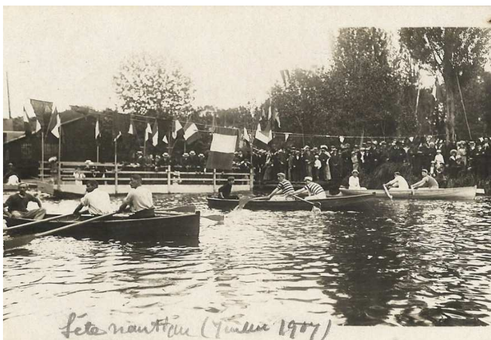
Fête nautique (début des années 1900)