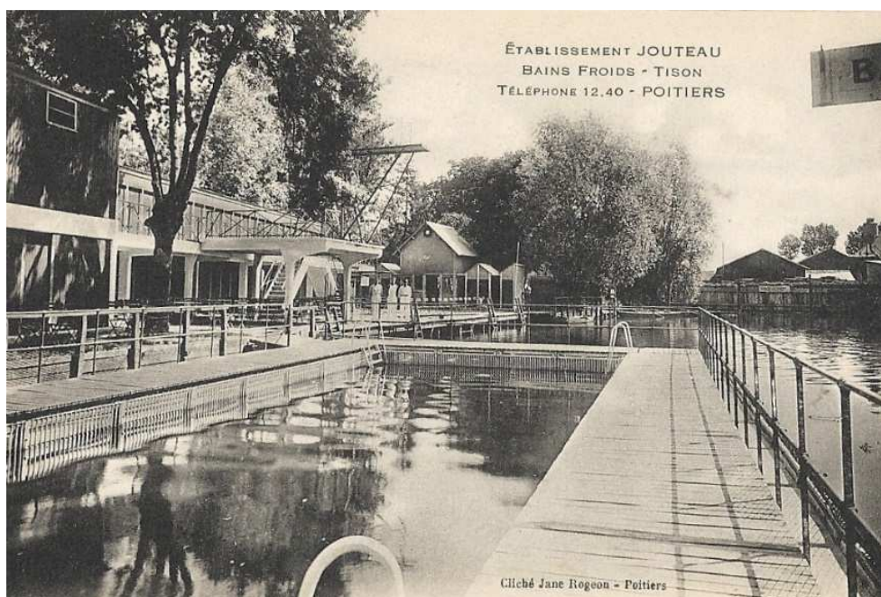
Les Bains Froids (début des années 1930)

Le site est alors abandonné ; seule reste habitée la maison occupée par Mme Jouteau. Le site est racheté par la ville de Poitiers qui y installe un restaurant de réinsertion professionnelle en juin 2009.