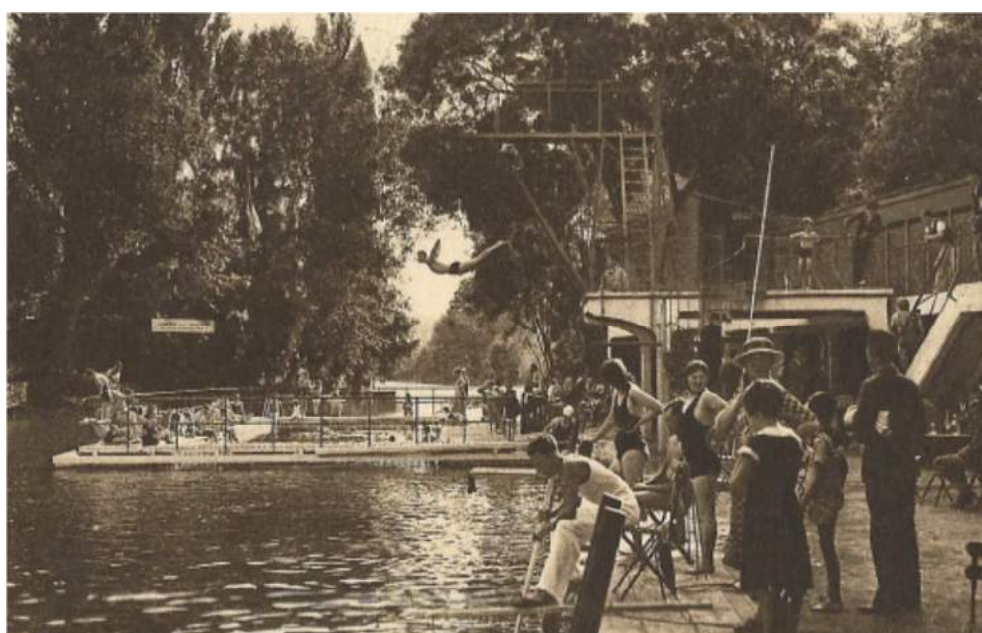
Leçon de natation (maître-nageur assis au premier plan) et plongeon de « la girafe » en arrière-plan