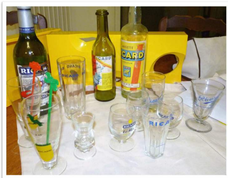
Ensemble de bouteilles et verres