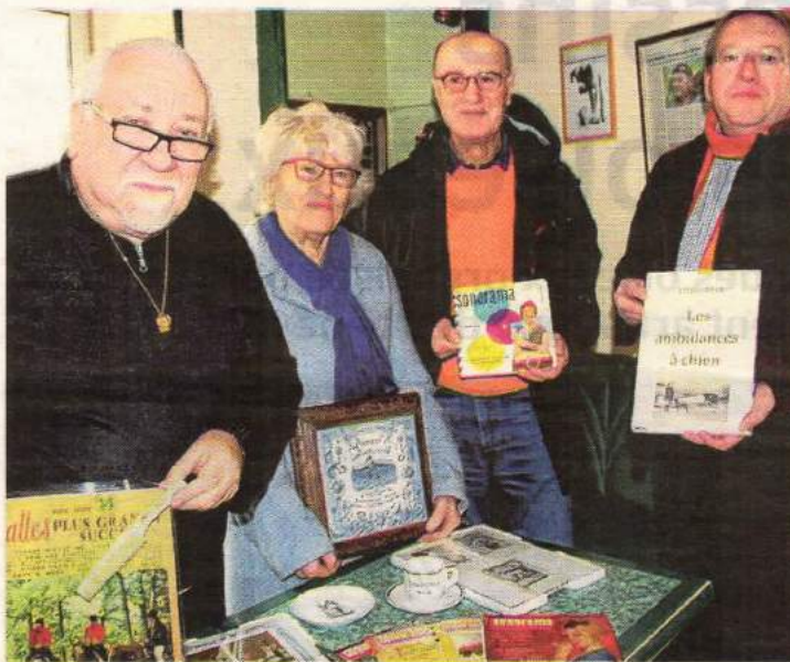
Les membres de l'ACP présenteront cinq collections originales dans le hall de La Hune.