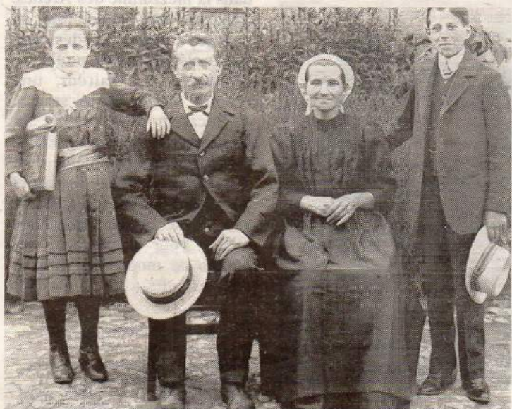
Les cartes postales anciennes seront encore les vedettes du salon.